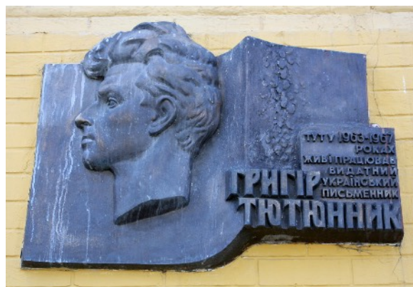
Меморіальна дошка, присвячена Григору Тютюннику